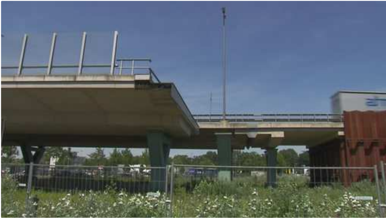
Aktuell endet die nicht fertige A281 in der Neustadt.