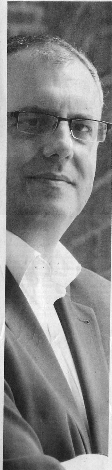
SPD-Landesvorsitzender Andreas Bovenschulte betont die Bedeutung der A 281 für die Stadt. Gleichzeitig plädiert er dafür, auch beim Güterverkehr auf der Schiene über Umgehungsstrecken nachzudenken.